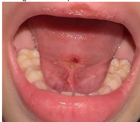
Figura 8 – Pós-operatório de 7 dias

No controle de sete dias, observou-se cicatrização satisfatória, e restabelecimento funcional significativo da mobilidade lingual. A responsável relatou melhora na aceitação alimentar, maior tolerância à escovação dentária e progressos na comunicação oral da criança (Figura 8).