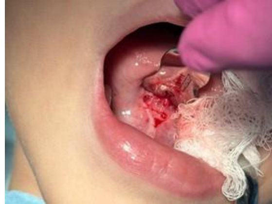
Figura 4 – Visualização da incisão