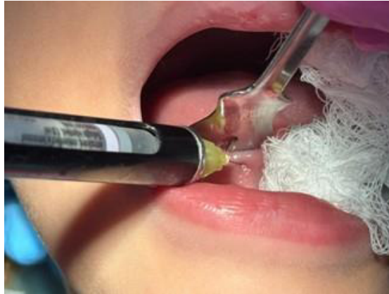
Figura 2 – Anestesia local com a técnica infiltrativa

O protocolo anestésico seguiu rigorosamente os parâmetros de segurança pediátrica. Após aplicação tópica de benzocaína 20% (Benzotop ® ) na região sublingual, procedeu-se à infiltração local com lidocaína 2% associada à epinefrina 1:100.000 (DFL ® ). O paciente, com peso corporal de 20 kg, teve sua dose máxima calculada segundo a recomendação de 4,4 mg/kg, totalizando 88 mg de lidocaína. Considerando que cada tubete de 1,8 mL de lidocaína 2% contém 36 mg do anestésico (2% = 20 mg/mL × 1,8 mL), o valor máximo permitido corresponderia a aproximadamente 2,4 tubetes. Durante o procedimento, foi administrado apenas 1 tubete (1,8 mL), correspondente a 36 mg de lidocaína com 18 µg de epinefrina.