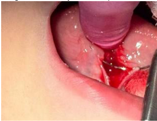
Figura 5 - Visualização da área após divulsão