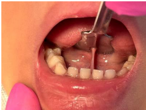
Figura 1 – Aspecto clínico intrabucal inicial com limitação da protrusão e elevação da língua

Na anamnese minuciosa, a genitora relatou dificuldades alimentares, seletividade alimentar marcada, resistência à higiene oral domiciliar e atraso significativo na aquisição da fala. A documentação médica anexada ao prontuário confirmou o diagnóstico de TEA, emitido por equipe multiprofissional. Ao exame funcional, observou-se restrição da protrusão e elevação lingual, compatível com anquiloglossia grau II, segundo a classificação de Kotlow, com prejuízo funcional evidente (Figura 1).