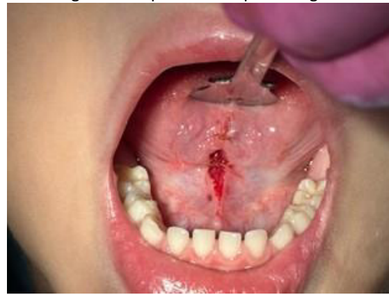
Figura 6 - Aspecto final após cirurgia