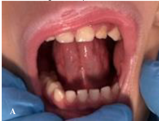
Figura 9 – Aspecto final

objetivo promover a adequação dos movimentos da língua, aprimorar a articulação da fala e estimular o fortalecimento muscular orofacial, favorecendo a evolução funcional obtida com a liberação do frênulo. A intervenção fonoaudiológica contribuiu significativamente para o progresso da comunicação oral e para a coordenação dos movimentos lingual e labial, aspectos essenciais para o desenvolvimento global da criança (Figuras 9 e 10).