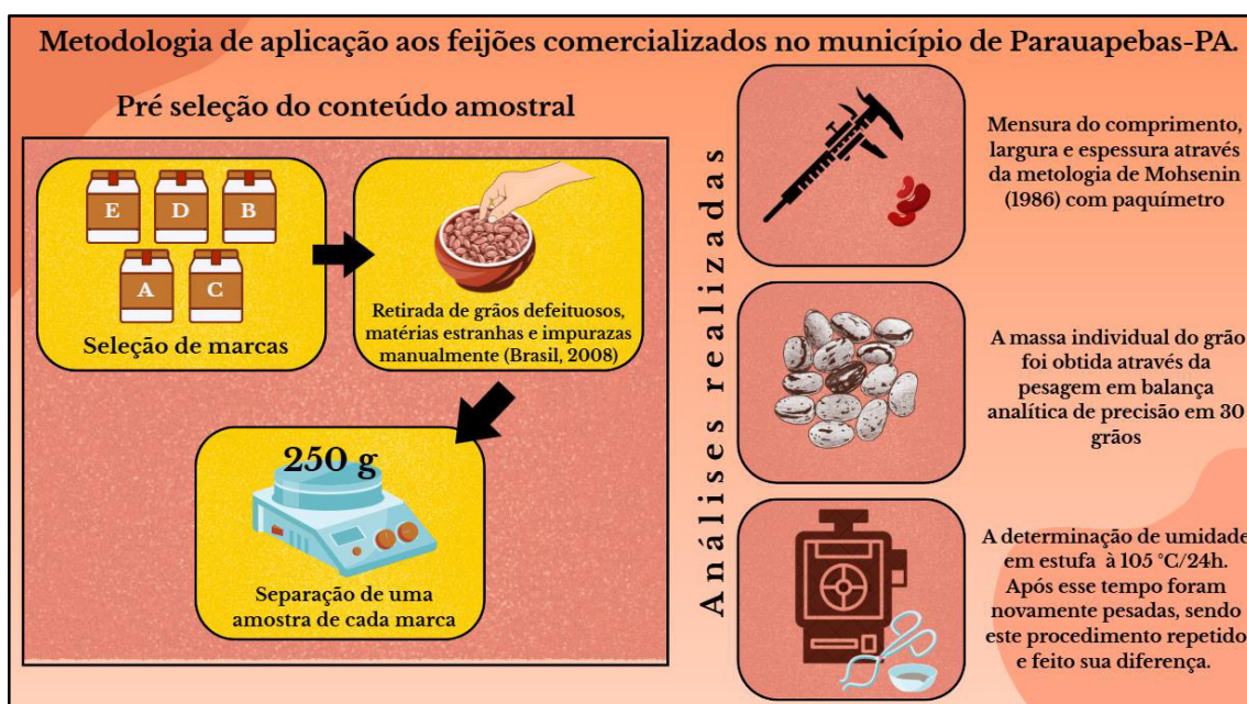
Figura 01 - Metodologia de aplicação aos feijões comercializados no município de Parauapebas-PA.

A determinação do conteúdo de umidade das diferentes amostras foi realizada a partir da pesagem de amostras em triplicatas com peso de 4,900 \pm 0,010g , a pesagem foi realizada com o auxílio de uma balança de precisão milesimal. As amostras foram pesadas e levadas para a estufa previamente aquecida à temperatura de 105^\circ C por 24 horas. Após esse tempo foram novamente pesadas, sendo este procedimento repetido nos três dias subsequentes.